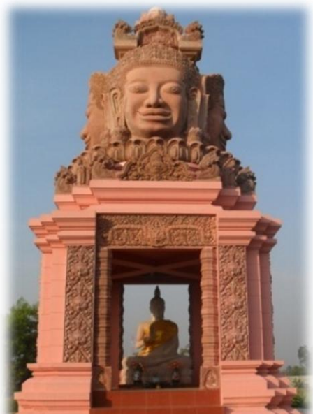
พระพุทธรูปไพศาลมณีศรีมงคล