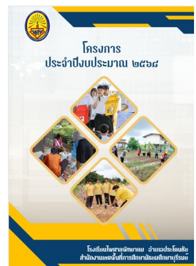
ภาพแผนพัฒนาการศึกษาขั้นพื้นฐาน / แผนปฏิบัติการ / โครงการ