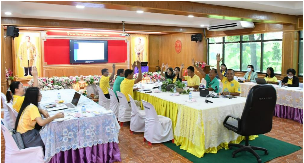
ภาพการรับรองโครงการของโรงเรียนปีงบประมาณ 2568