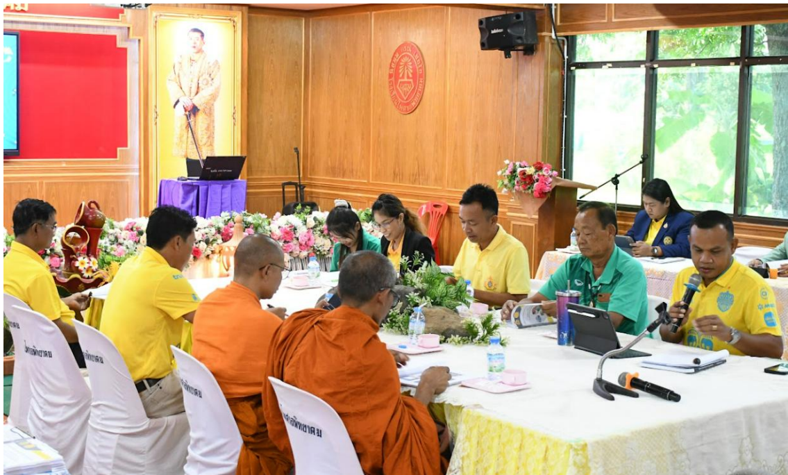
ภาพการประชุมคณะกรรมการสถานศึกษาเกี่ยวกับงบประมาณ ปีงบประมาณ 2568